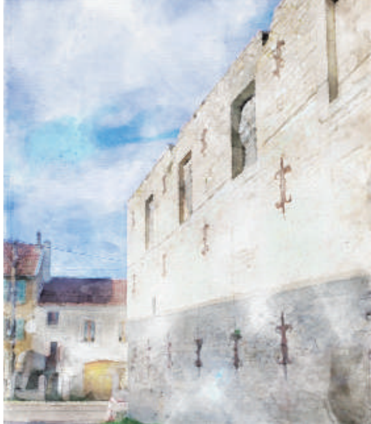
Verrey-sous-Salmaise La magnanerie