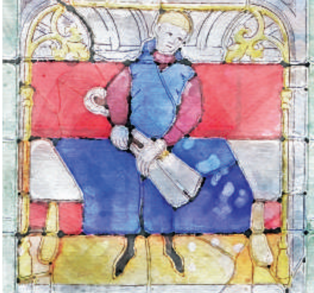
Semur-en-Auxois Vitrail de la collégiale