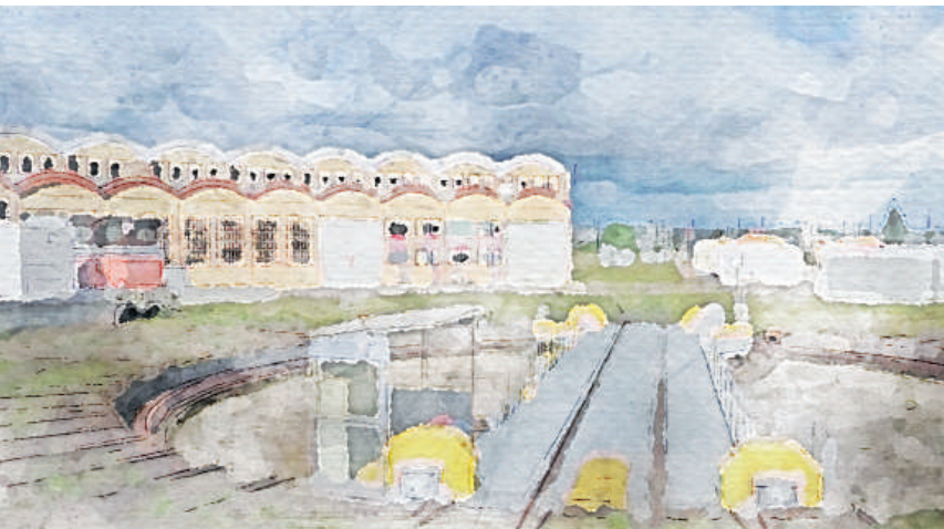
Venarey-Les Laumes Rotonde ferroviaire