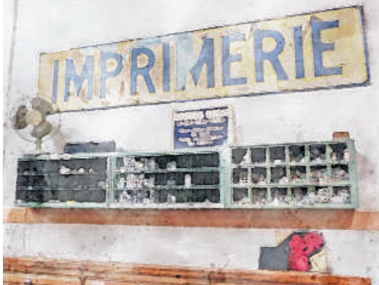
Semur-en-Auxois Imprimerie Intaglio