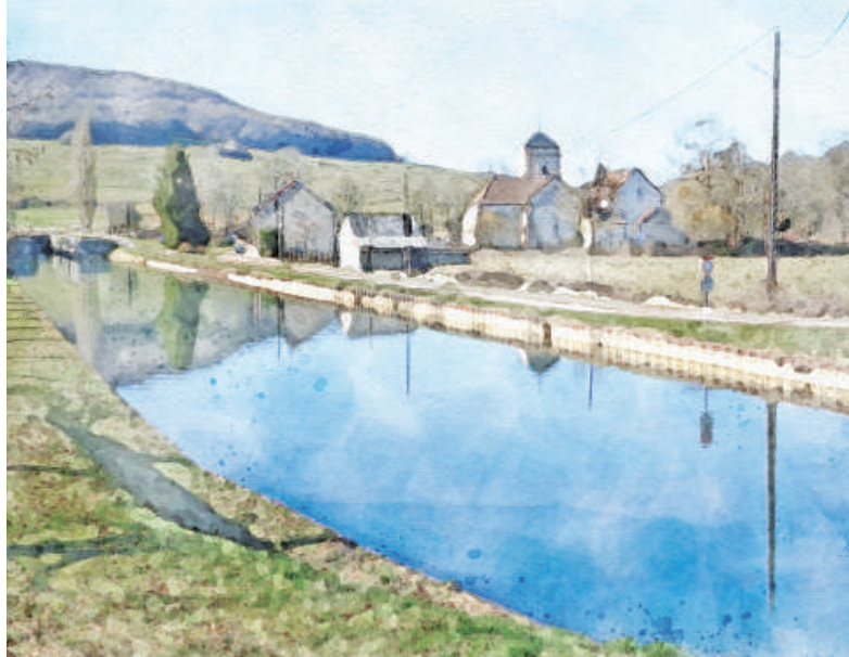
Crugy Le canal