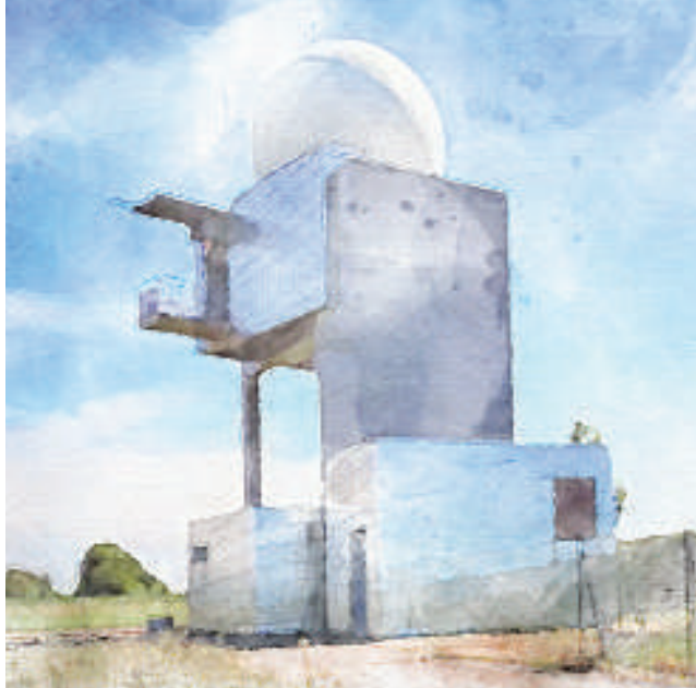
Blaisy-Haut Radar de Météo France, photo d'origine ©M. Quiquemelle