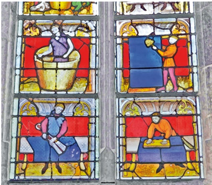
Semur- en-Auxois Vitreaux de la collégiale