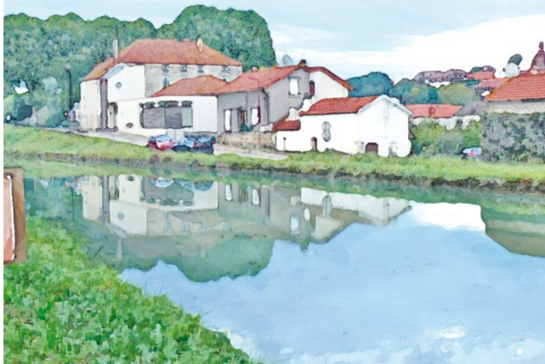
Saint-Rémy Entrée du village