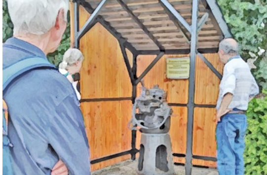
Saint-Germain-de-Modéon Forgeuse à burins